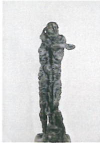
Selim Abdullah Attorcitura 1989 bronzo 173 x 51 x 41 cm Collezione Città di Lugano