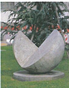
Max Bill Semisfera attorno a due assi 1965-1966 granito del Gottardo 100.5 x 120.5 x 112 cm Collezione Città di Lugano