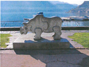
Piero Travaglini Rinoceronte 1977 granito 95.5 x 164 x 48 cm Collezione Città di Lugano