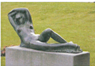
Mario Bernasconi Il risveglio 1954 bronzo 83 x 170 x 69 cm Collezione Città di Lugano