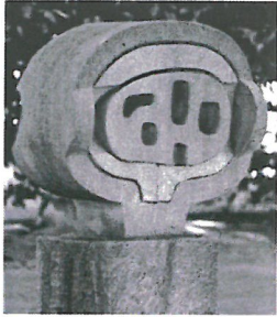
Pierino Selmoni Eco 1976 granito della Calanca 90 x 109 x 47 cm Collezione Città di Lugano