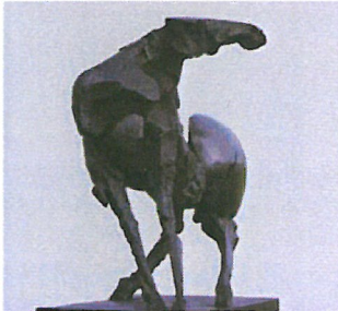
Nag Arnoldi Cavallo 1977 bronzo 192.5 x 82 x 140 cm Collezione Città di Lugano